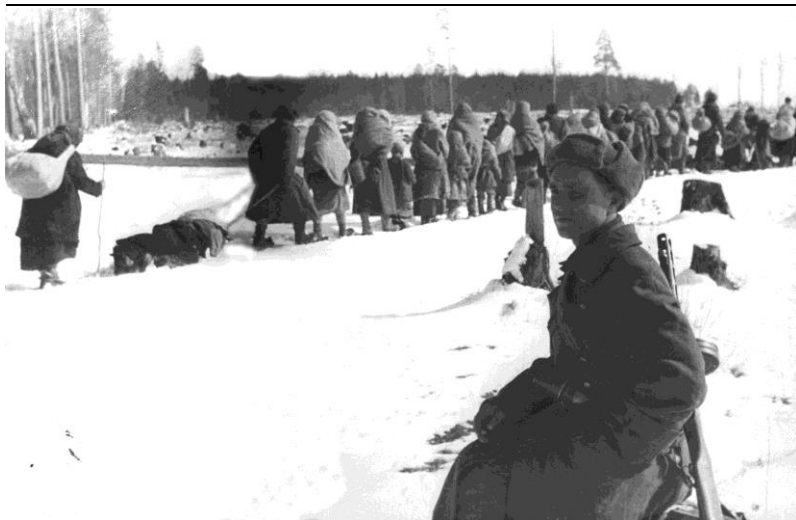
ОТ-235. Возвращение гражданского населения в родные места после освобождения Рогачева от немецко-фашистских захватчиков. Январь 1944 г.