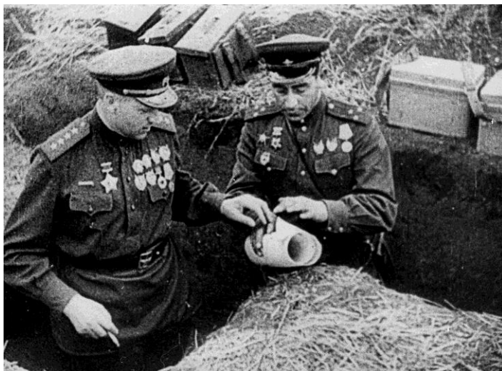
0-120547. Командующий Белорусским фронтом генерал армии К. К. Рокоссовский во время проведения Гомельско-Речицкой операции. 10 ноября 1943 г., Гомельская область