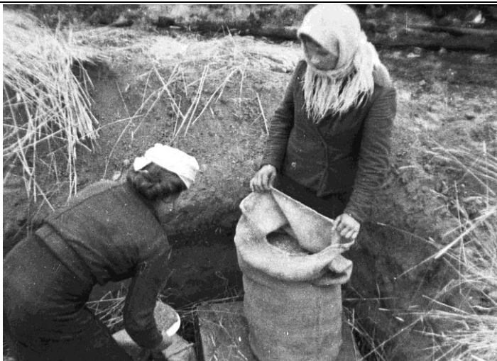
0-127202. Жители Кричева после освобождения города войсками Красной Армии достают из ям зерно, спрятанное от немецко-фашистских оккупантов. 1943 г., Могилевская область