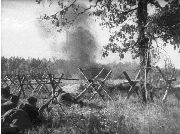
0-34017. Передовые части Красной Армии преодолевают оборонительную полосу противника во время начала освобождения территории Беларуси от немецко-фашистских захватчиков. 1943 г., Гомельская область