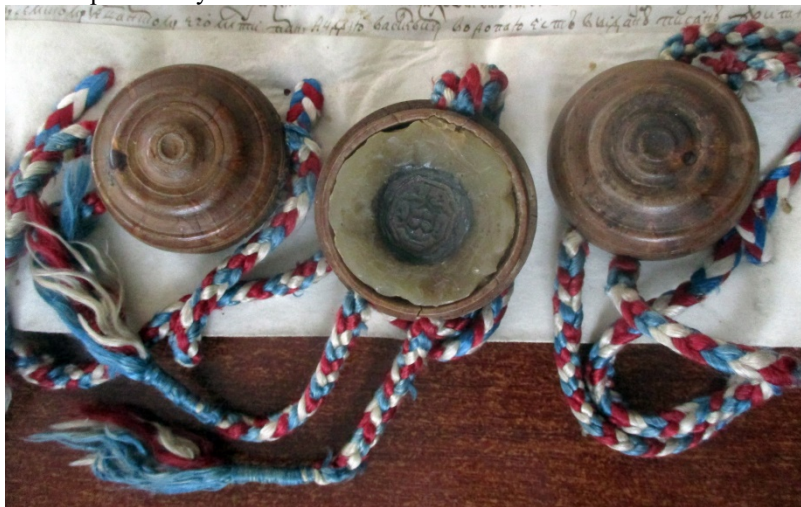
Мал. 3. Чашкі для пячатак і пячатка падсудка земскага суда Віцебскага павета Бальцара Багоданавіча Старасельскага з выпісу земскага суда Віцебскага павета ад 30 мая 1589 г. аб куплі А. Варпааем маёнткаў Лучоса ў братоў Юшкоўскіх

У выпісе аб куплі маёнтка Лучоса ў братоў Юшкоўскіх захаваліся прывесістыя пячаткі судзі, падсудка і пісара земскага суда Віцебскага ваяводства. Пячаткі мацаваліся шоўкавым шнуром, які быў сплечены з трох шнуркоў рознага колеру: белага, чырвонага, светла-сіняга. На шнурках мацаваліся драўляныя футляры такарнай работы для пячатак (гл. мал. 3). Крышкі футляраў не зберагліся. У футляры быў заліты жоўты воск, самі пячаткі земскіх ураднікаў выкананы на чорным воску.