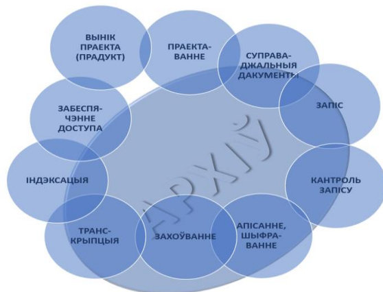
Мал. Удзел архівістаў у асноўных этапах працы з дакументамі вуснай гісторыі

Такім чынам, большая частка працэсаў вуснай гісторыі патрабуе ўдзелу архівіста цалкам ці часткова (гл. малюнак):