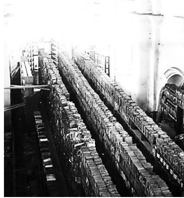
Расположение стеллажей и дел в хранилище здания бывшего костела Бернардинского монастыря. [1928—1933 гг.]

Таким образом, 12 сентября 1922 г. было завершено организационное оформление централизованной архивной службы Беларуси и ее руководящего органа. В последующие годы в Беларуси была создана разветвленная сеть государственных архивных учреждений, разработано нормативно-методическое обеспечение в сфере архивного дела и делопроизводства, создана достойная материально-техническая база, укреплен кадровый потенциал архивов. Традиции централизованного управления архивным делом сохраняются и в настоящее время, что способствует качественному формированию Национального архивного фонда Республики Беларусь, его сохранению и эффективному использованию.