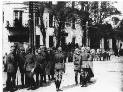
Солдаты армии кайзера в г. Минске. 1918 г.